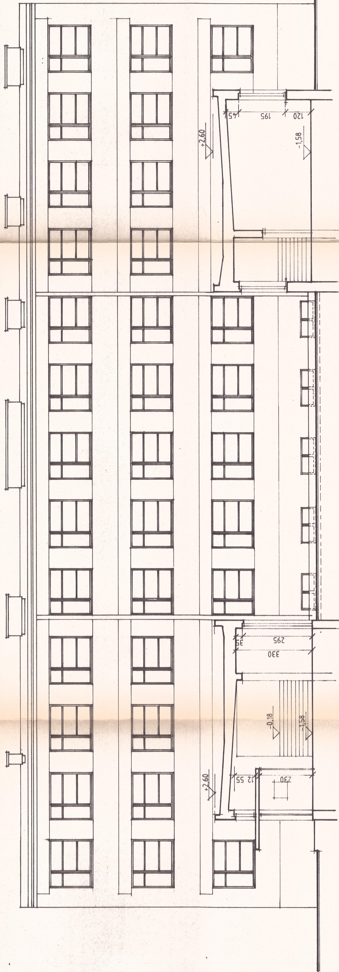
PRZEKRÓJ F-F I ELEWACJA ZACHODNIA BLOKU C - 1:100 - INWENTARYZACJA